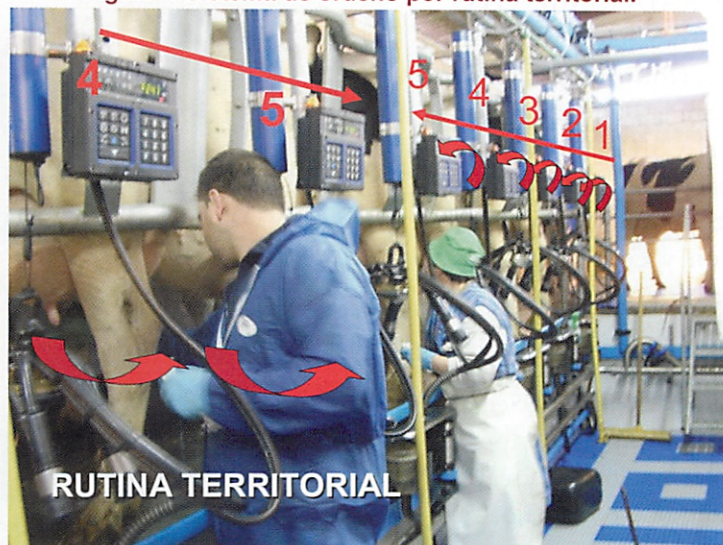
Figura 1. Sistema de ordeño por rutina territorial.

Cada operador se ocupa de todas las rutinas de ordeño de un número determinado de animales. Así, en la foto el operario de azul se encarga de todas las rutinas de 5 animales (sólo dos se ven en la foto, seguiría 3-2-1). El operario de gorra verde se ocupa también de todas las rutinas de 5 animales (de la línea amarilla vertical hacia la derecha).