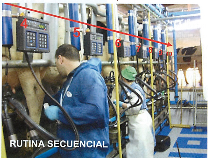
Figura 2. Sistema de ordeño por rutina secuencial.

Las rutinas de preparación para el ordeño en las grandes salas requieren y son más eficientes con altas